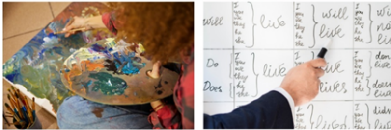
MENAI | KULTŪRA