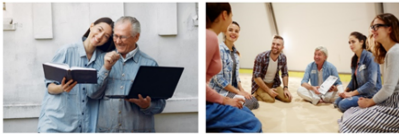
ŽMOGUS IR VISUOMENĖ