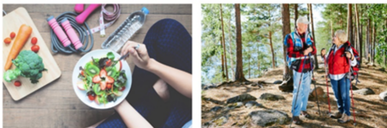
SVEIKATA | SPORTAS | MITYBA